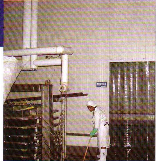
Cumple con la norma: NOM-008-ZOO-1994